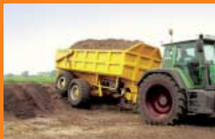
Une puissance transmise contrôlée jusqu'à 125 kW

Des outils plus grands et plus lourds constituent un fardeau croissant pour les tracteurs qui doivent les remorquer. Sauer-Danfoss peut désormais aider ses clients à alléger cette charge tout en augmentant la productivité, et ce même dans les conditions les plus défavorables.